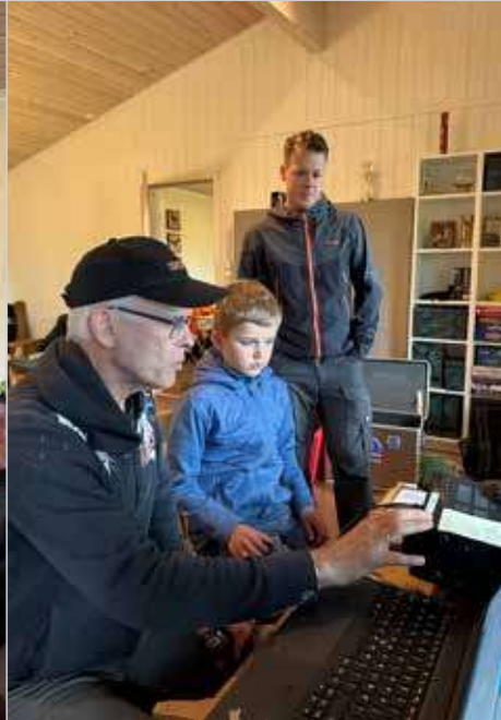
En speiders første møte med amatørradio.