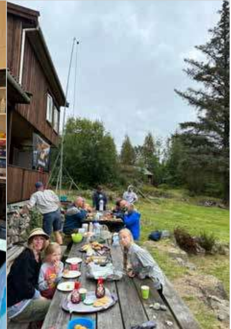
Mange deltakere var innom i løpet av dagen.

Haugalandgruppen LA4C samarbeidet i år med 1. Skudeneshavn Speidergruppe om Field Day og Speiderplass-turen. Anslagsvis 200 besøkte stasjonen i løpet av helgen. Godt besøk skyldes omtale på Karmøy-nettstedet skudeneshytt.no.