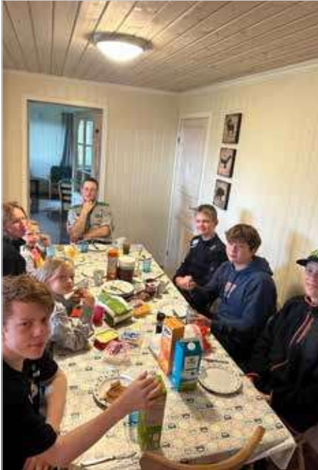
God stemning rundt frokostbordet.